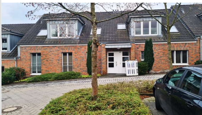
Ansicht vorne neu

Zimmer: 3,00 Wohnfläche ca.: 87,00 m 2 Kaufpreis: 336.000,00 EUR